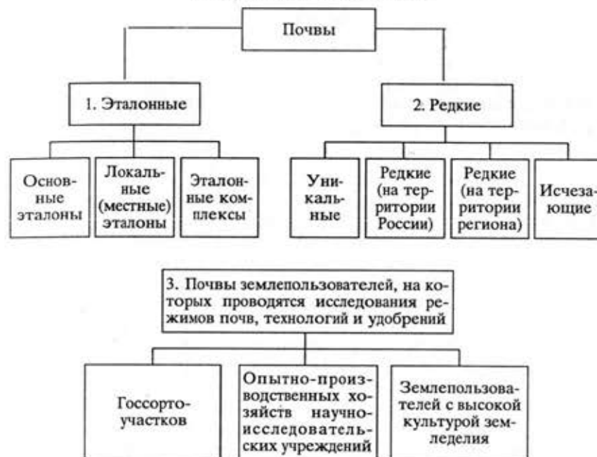
Схема соподчиненности почв Оренбургской области (материалы для Красной книги)

тественного плодородия, также нуждаются в особом охранном обеспечении.