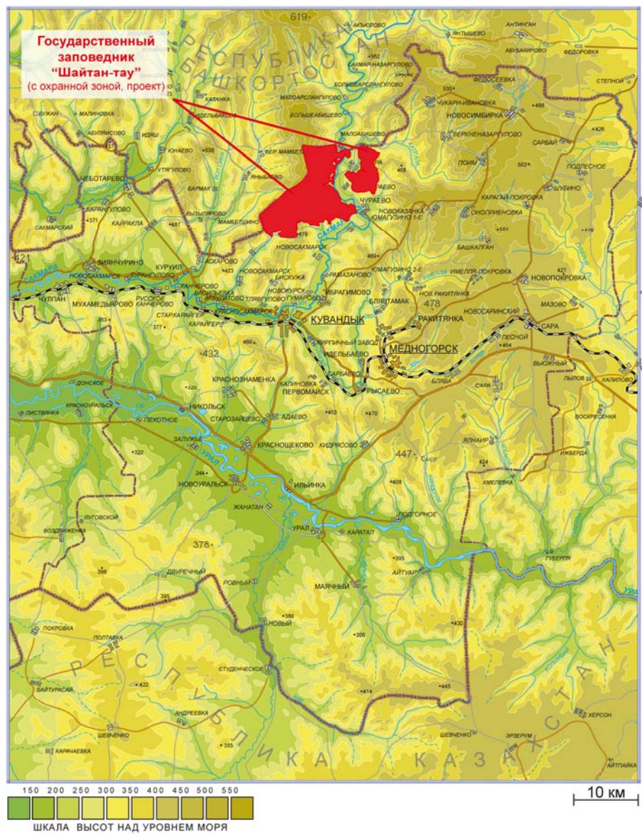
Рис.2. – Государственный природный заповедника «Шайтан-Тау».