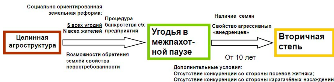
Рис. 1. – Логическая схема развития вторичной степи.

1.2. На основании разработок Института степи УрО РАН издано Постановление Правительства Российской Федерации № 1035 от 9 октября 2014 года об учреждении государственного природного заповедника «Шайтан-Тау», площадью 6726 га в Кувандыкском муниципальном районе Оренбургской области (рис. 2). «Шайтан-Тау» - первый в Европе заповедник, взявший под охрану государства горно-лесостепные ландшафты на юго-восточном пределе распространения широколиственных лесов.