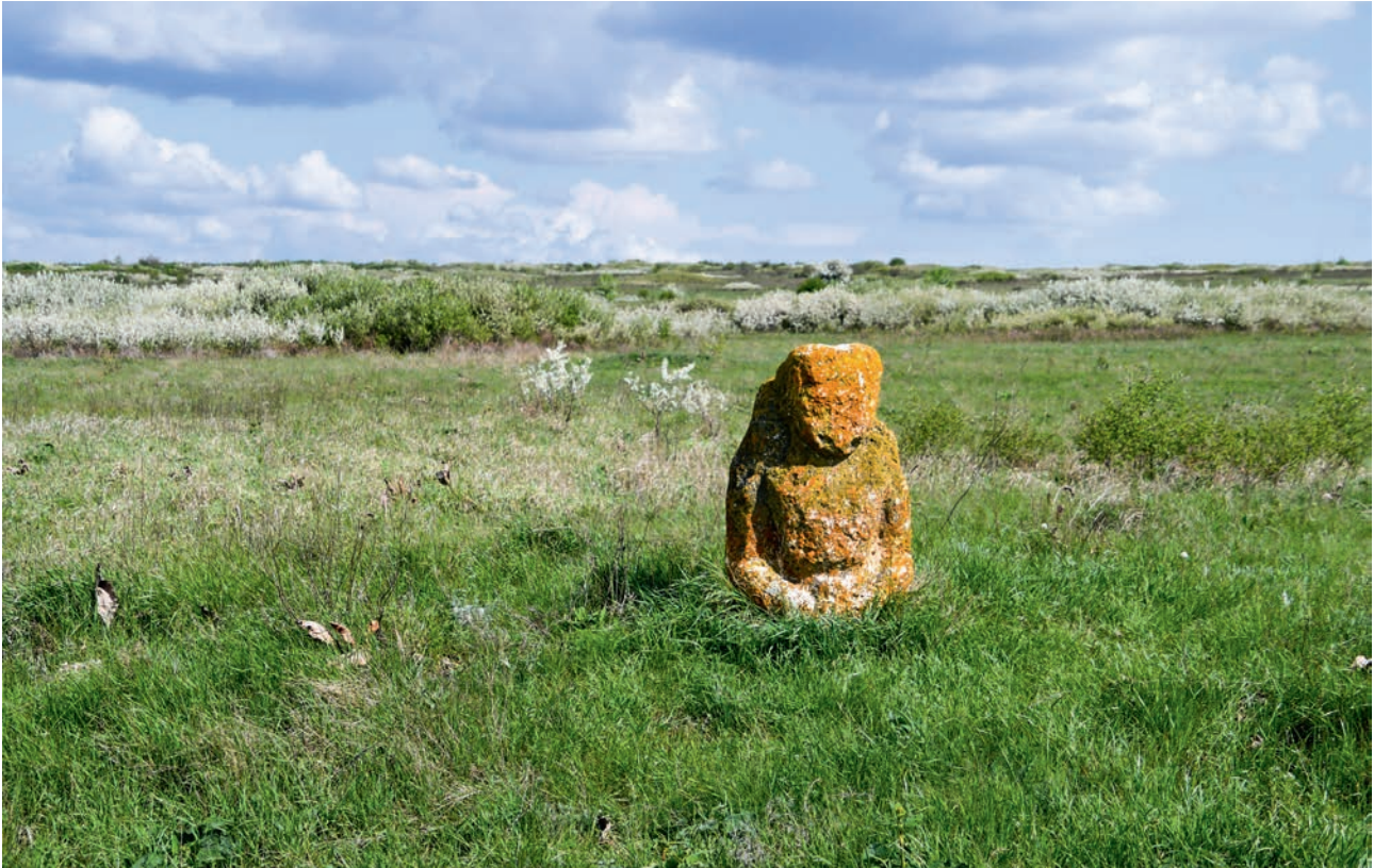
КАМЕННАЯ БАБА В ХОМУТОВСКОЙ СТЕПИ (АЧ)