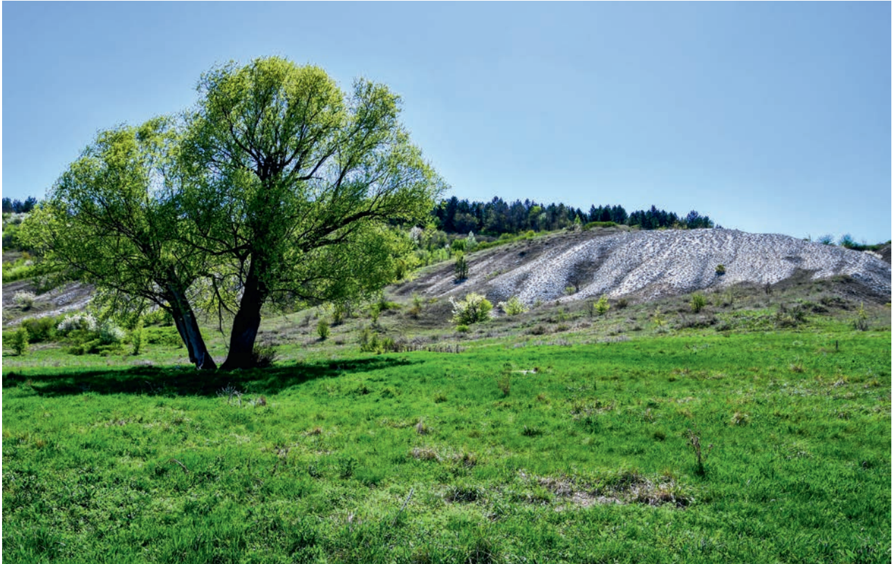
МЕЛОВАЯ ГОРА-ОСТАНЕЦ У С. ГОРОДИЩЕ (АЧ)