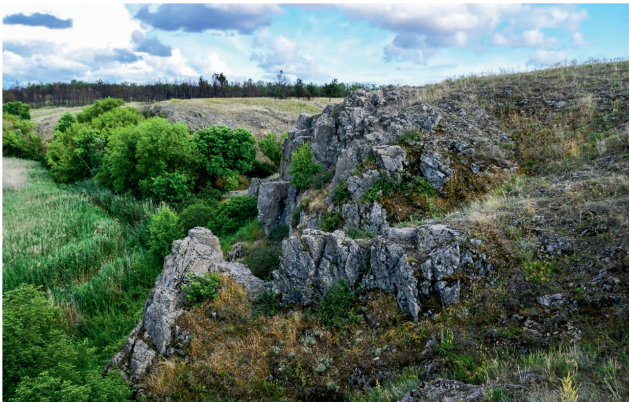
ГЛОДОВСКИЕ СКАЛЫ НА РЕКЕ БЕРДЕ (АЧ)