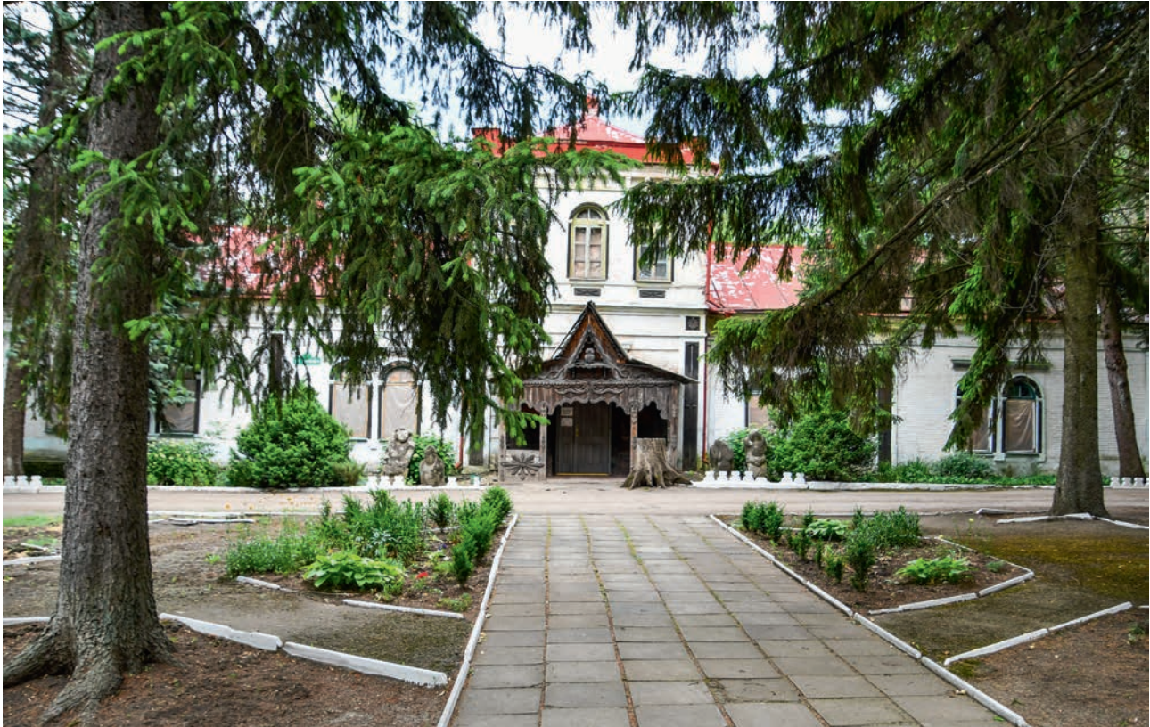
МУЗЕЙ ЛЕСА В ВЕЛИКОМ АНАДОЛЕ (АЧ)