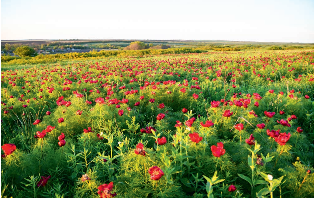
ПИОННИКИ В ХОМУТОВСКОЙ СТЕПИ (АЧ)