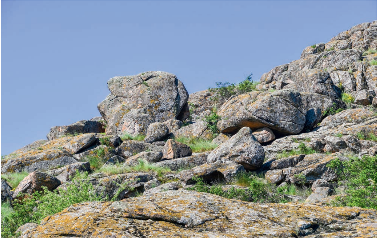
ЗАПОВЕДНЫЕ «КАМЕННЫЕ МОГИЛЫ» (АЧ)