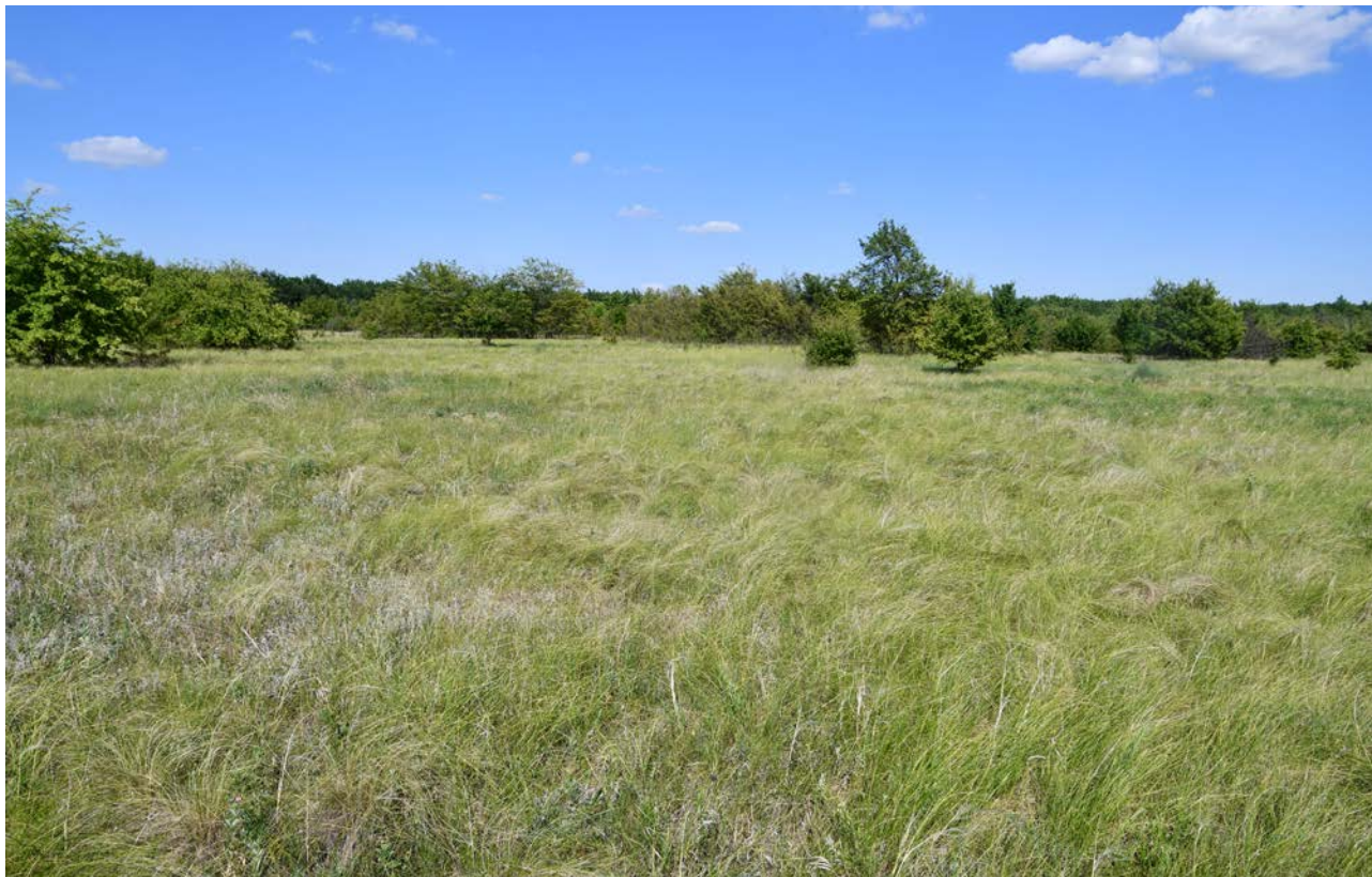
ЗАПОВЕДНАЯ СТЕПЬ В ЗАКАЗНИКЕ «ЮНИЦКИЙ» (АЧ)