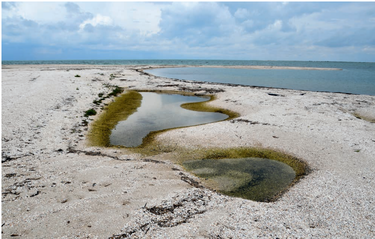
ОБИТОЧНАЯ КОСА (АЧ)