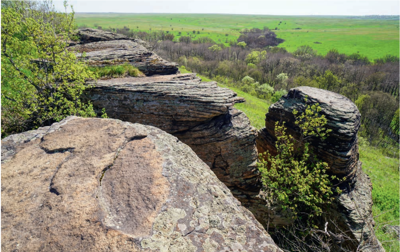
БАЛКА СКЕЛЕВАТАЯ (АЧ)