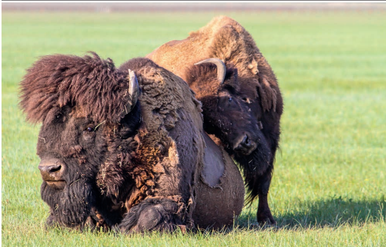
АСКАНИЯ-НОВА. БИЗОНЫ (АЧ)