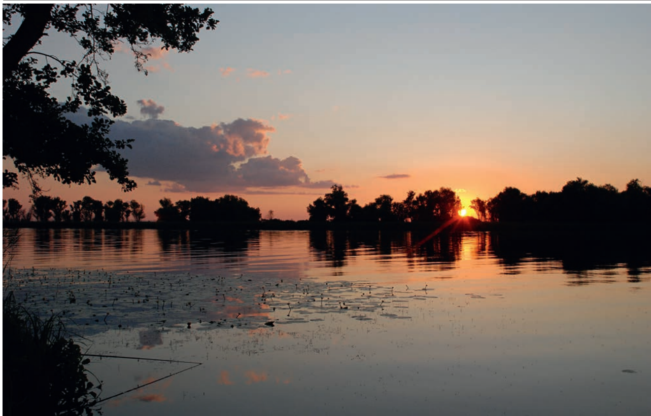
НИЗОВЬЯ ДНЕПРА (ВС)