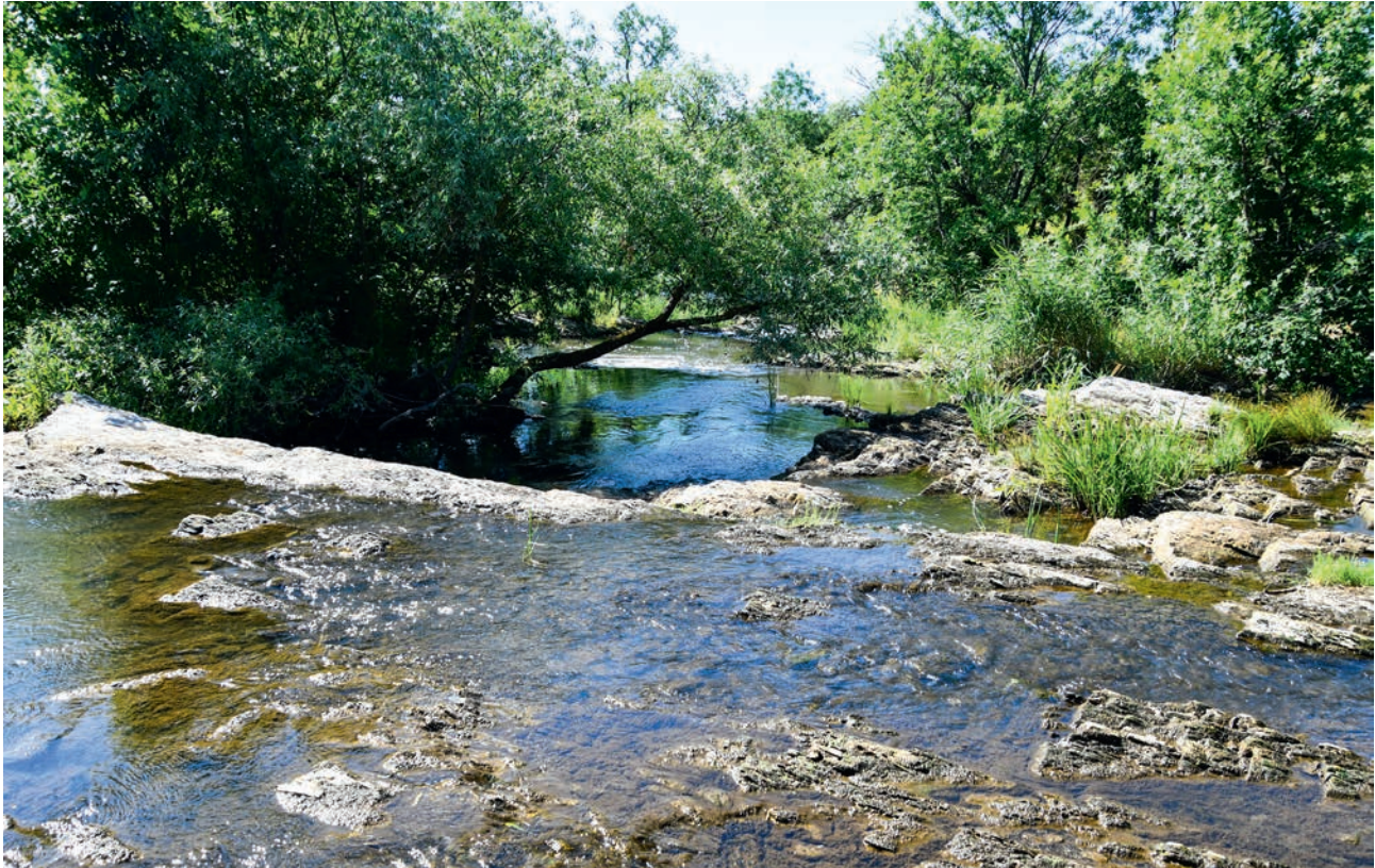
ПОРОГИ НА Р. КРЫНКА (АЧ)