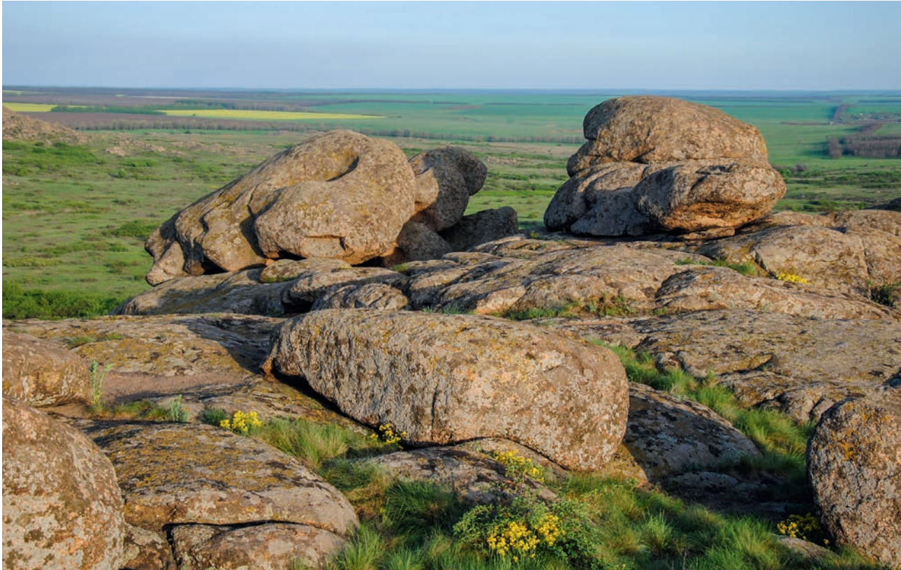
ЗАПОВЕДНЫЕ «КАМЕННЫЕ МОГИЛЫ» (АЧ)