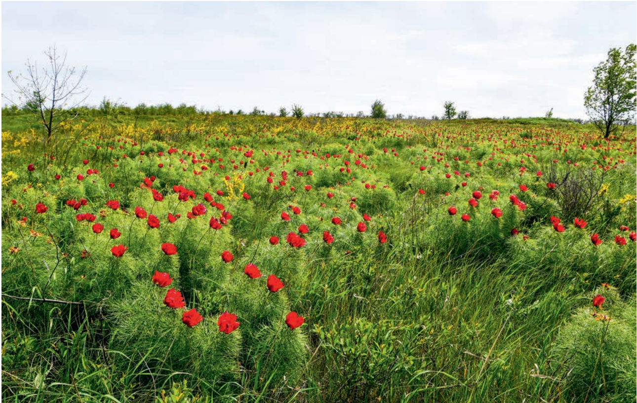
ПИОННИК В СТРЕЛЬЦОВСКОЙ СТЕПИ (АЧ)