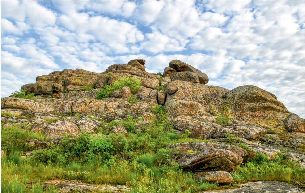
ЗАПОВЕДНЫЕ «КАМЕННЫЕ МОГИЛЫ» (АЧ)