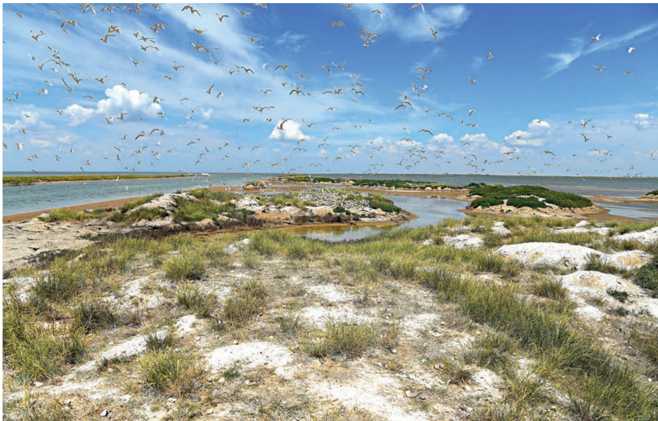
ПРИАЗОВСКИЙ НАЦПАРК (ВС)