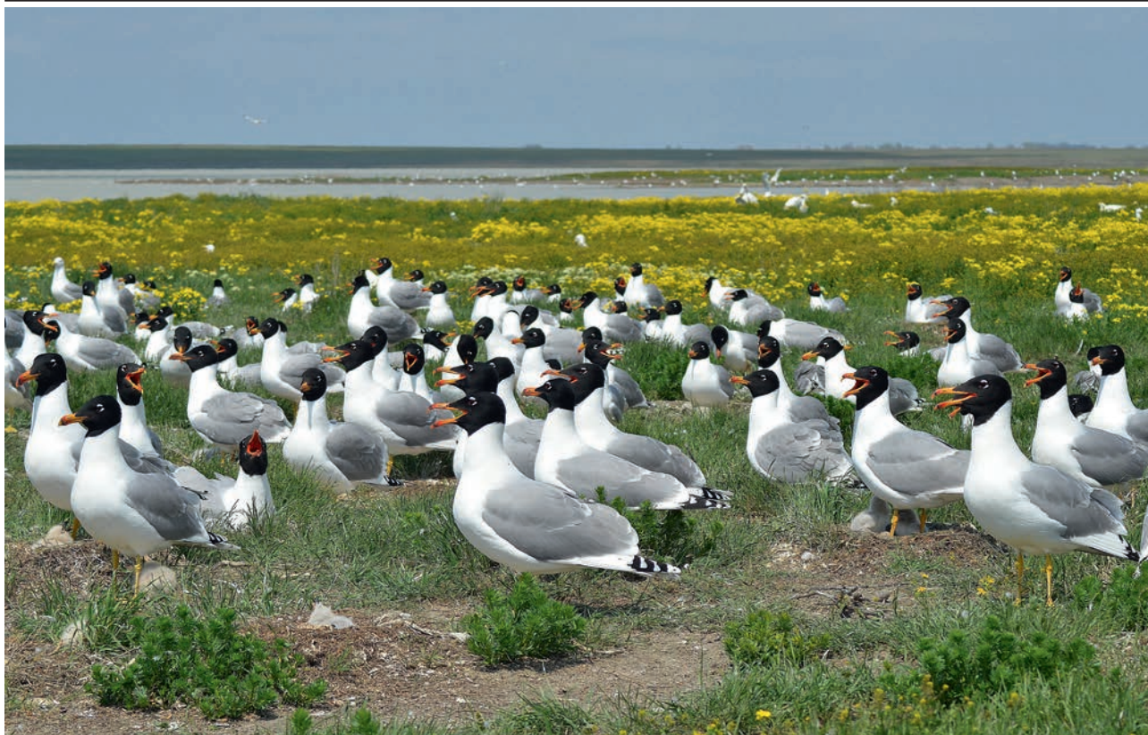
АЗОВО-СИВАШСКИЙ НАЦПАРК. ЧЕРНОГОЛОВЫЙ ХОХОТУН (ВС)