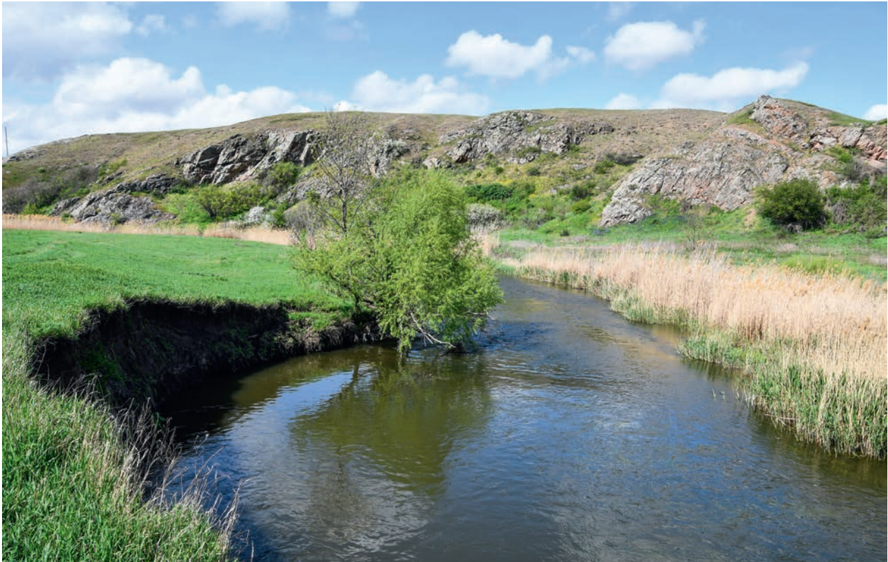
РЕКА КАЛЬМИУС (АЧ)