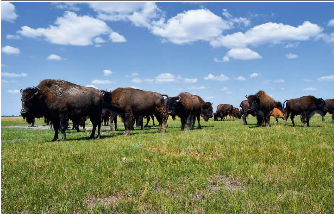
АСКАНИЯ-НОВА. БИЗОНЫ (АЧ)