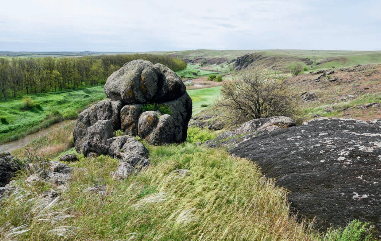
ДОЛИНА РЕКИ КАЛЬМИУС (АЧ)