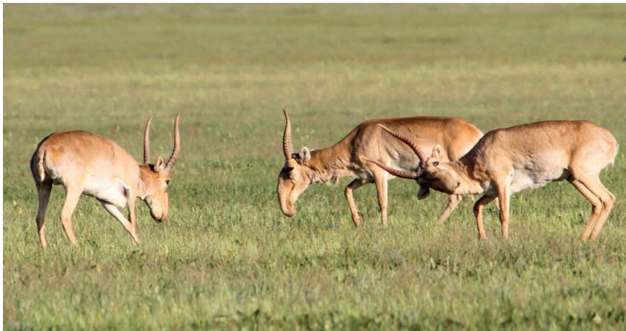
АСКАНИЯ-НОВА. САЙГАКИ (АЧ)