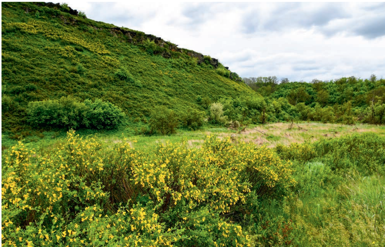
ЗАПОВЕДНИК «ЛУГАНСКИЙ». ОТДЕЛЕНИЕ ПРОВАЛЬЕ (АЧ)