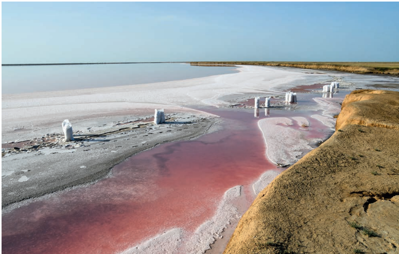
СТИХИЙНАЯ ДОБЫЧА СОЛИ НА ОЗЕРЕ РОЗОВОМ (ВС)