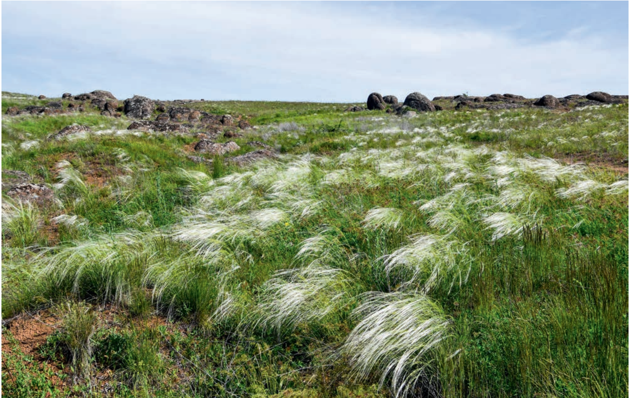
В «КАЛЬМИУССКОЙ СТЕПИ» (АЧ)