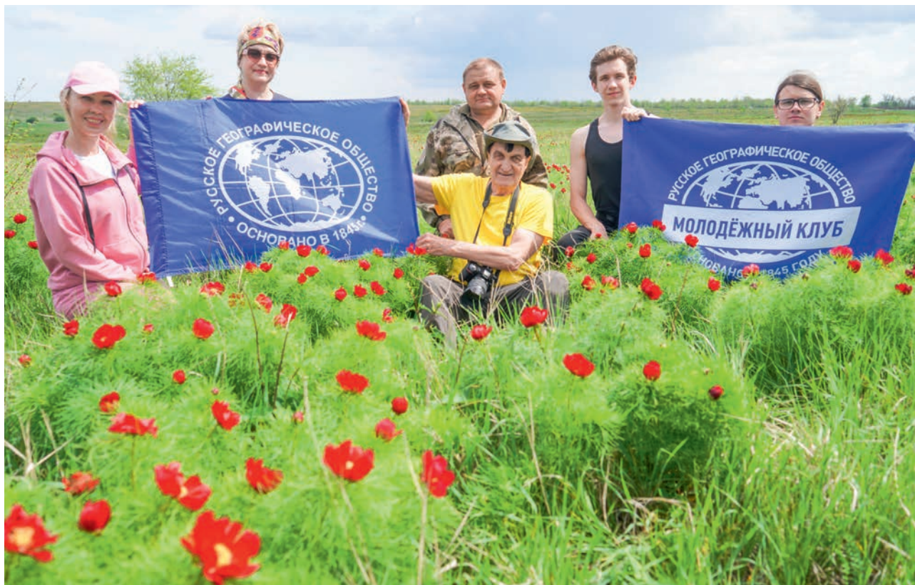
СТЕПНАЯ ЭКСПЕДИЦИЯ В СРЕЛЬЦОВСКОЙ СТЕПИ