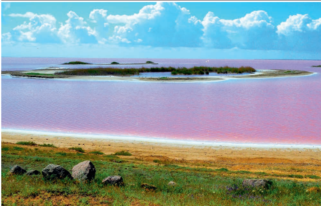
СТРОГОНОВСКИЕ ОСТРОВА (ВС)