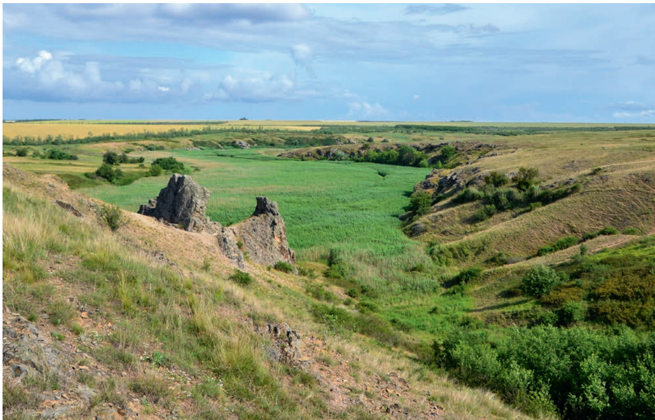
СКАЛЫ «ОСЛИНЫЕ УШИ» НА РЕКЕ БЕРДЕ (АЧ)